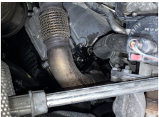
Yağ Sızdırmazlık (Motor)

✓ : Sorunsuz | * : Faal, Bakım Gerekebilir | ⚠ : Onarım/Değişim Gerekli