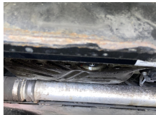
Yağ Sızdırmazlık (Motor)