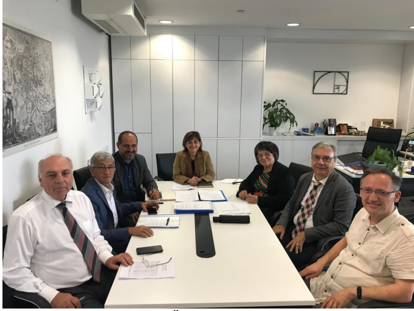
Kurul Üyeleri Toplantıda